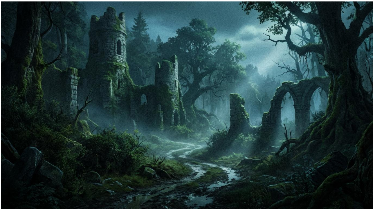
第 1 幕： 穆高爾森林入口

在穆高爾森林的深處，時間似乎停止了流動。這裡曾是充滿生機的古老之地，如今卻瀰漫著一股令人不安的氣息。里特、菲亞和他們的朋友們，肩負著連接人類與狼族的使命，此刻正踏入這片迷霧重重的森林，去尋找失落的力量，維護世界的平衡。